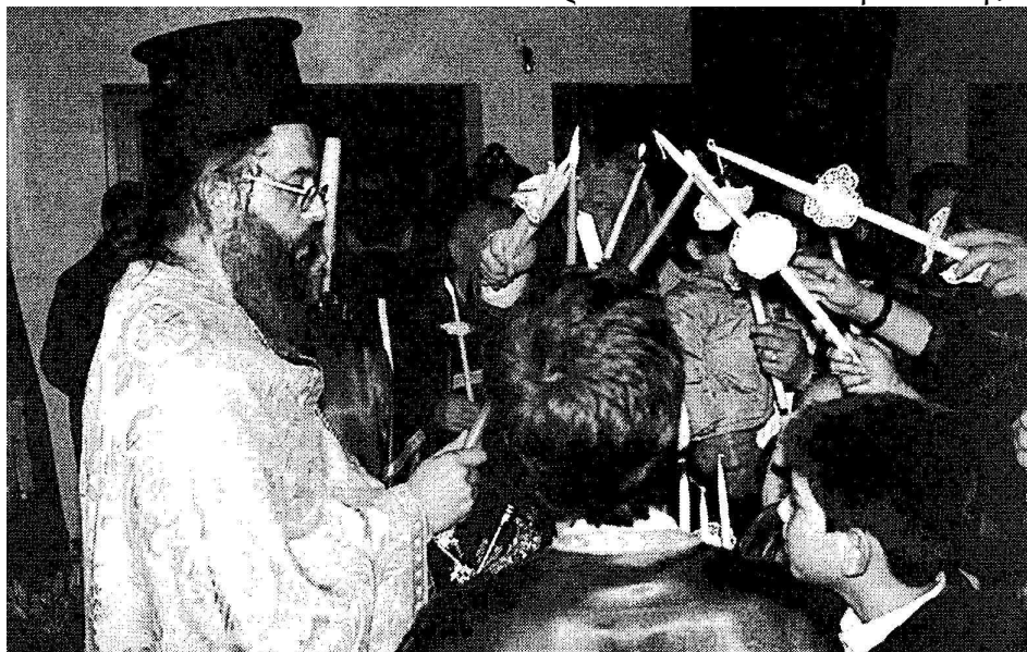
BR: Ostern 2001 – Πάσχα 2001

BR: 02.12.. Ιδρύεται το Συμβούλιο Χριστιανικών Εκκλησιών της πόλεως.