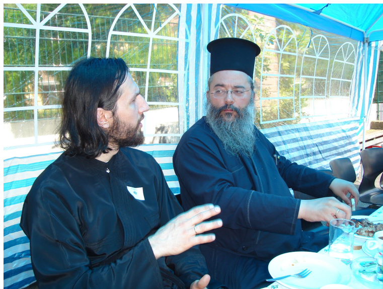
V.. Athanasios π. Αθανάσιος